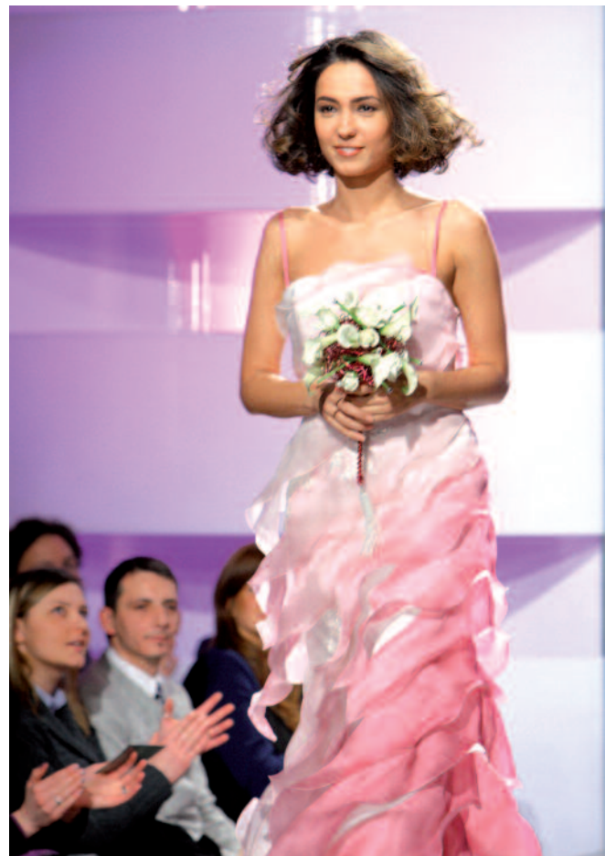
La conduttrice Rai Caterina Balivo in passerella

zione Rocco Palese, trovandosi al cospetto di giovani coppie che presto dovranno fare i conti con il problema dell'abitazione, ha colto l'occasio-