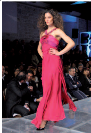
Due momenti della sfilata